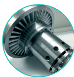
高速专利微型涡轮机

ENO-10LT模块是ENOGIA生产的ORC,即使是70°C的低品位热源后,也能够最高回收160 kWth的功率,额定输出功率10 kWe。