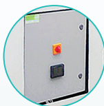
全天候远程控制和访问