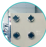
带标准法兰的液压连接