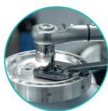
在ENOGIA车间进行组装和性能测试