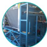
单滑轨即插即用系统